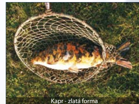
Kapr - zlatá forma