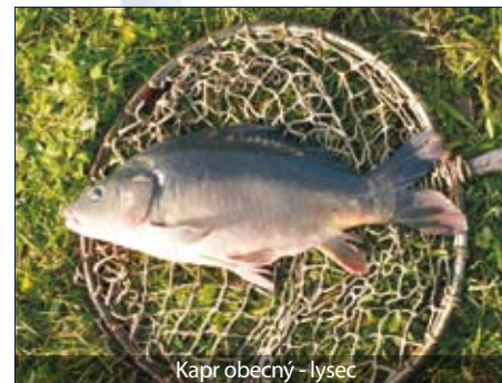
Kapr obecný - lysec