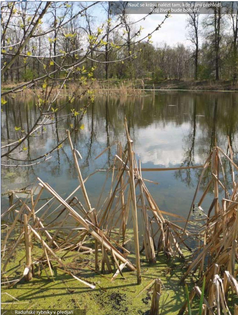
Raduňské rybníky v předjaří

Nauč se krásu nalézt tam, kde ji jiný přehlédl. Tvůj život bude bohatší.