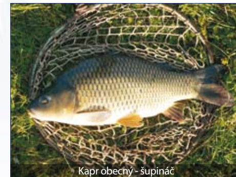
Kapr obecný - šupináč